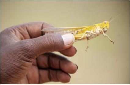
હાથ ધરવા અને આ અંગે જરૂરી પગલાં લેવા આદેશ કર્યો છે.